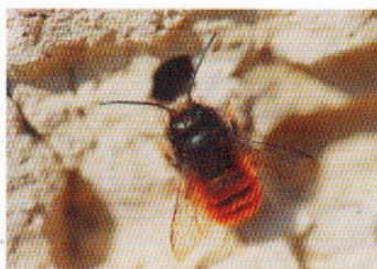
Leben in der Vertikalen

Eine begrenzte Ressource wird zur begehrten Ware