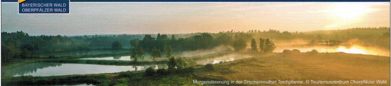
Morgenstimmung in der Tirschenreuther Teichpfanne.