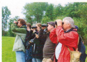
Verfechter der Vielfalt